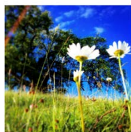
LE CHÊNE DE VENON *2019