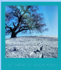
LE CHÊNE DE VENON *2018

Cette année la Municipalité propose des nouvelles cartes de vœux (demander en mairie)