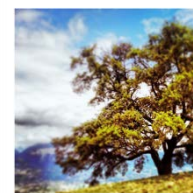
LE CHÊNE DE VENON *2019