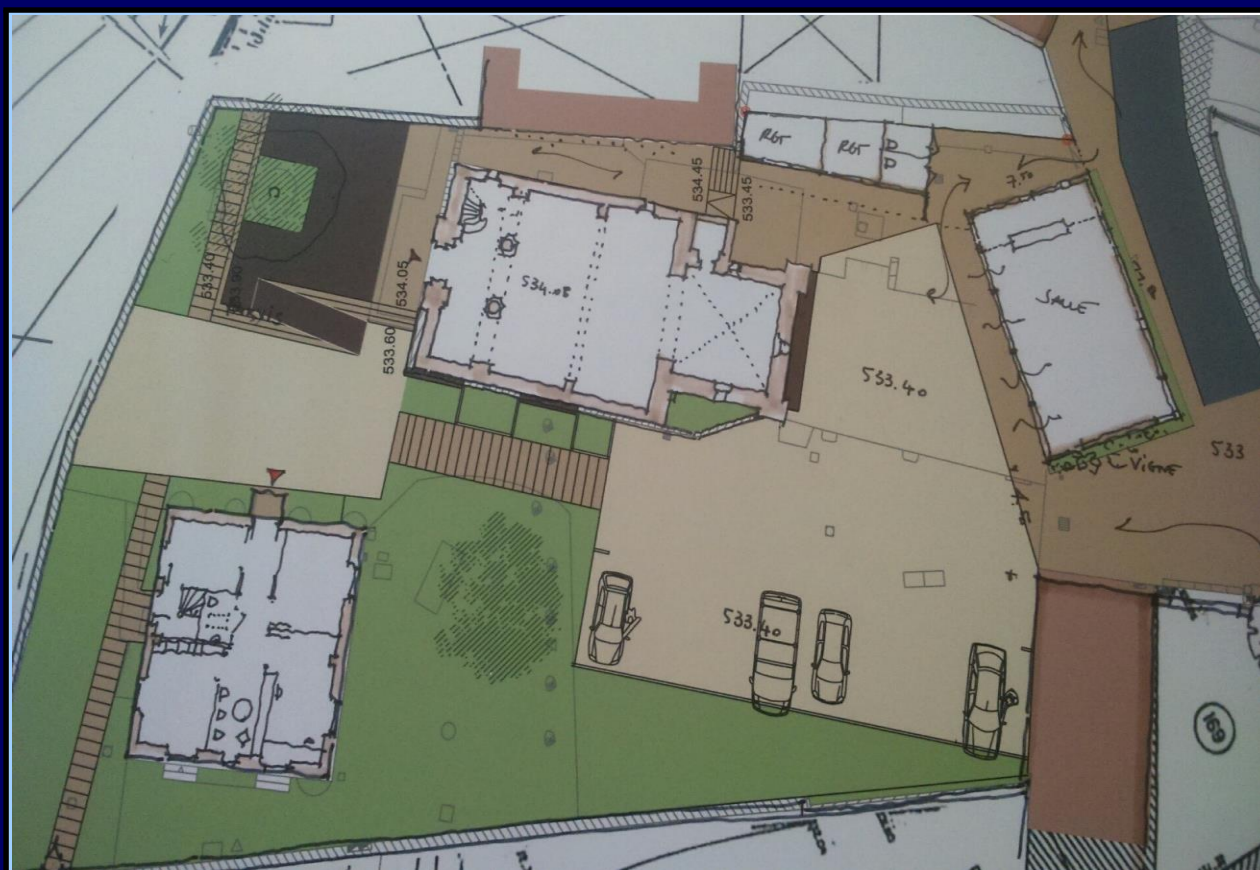
Projet de réhabilitation de la place du Village