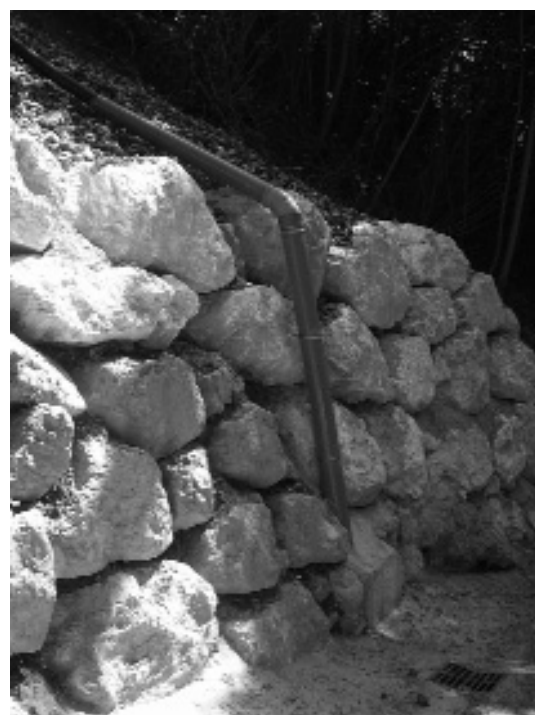
Suite à l'éboulis du talus de la route de Pressembois lors des in- tempéries de l'automne dernier l'enrochement a été terminé.