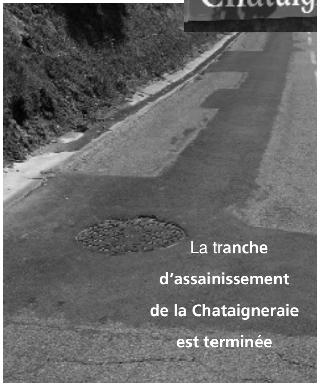
La tranche d'assainissement de la Chataigneraie est terminée