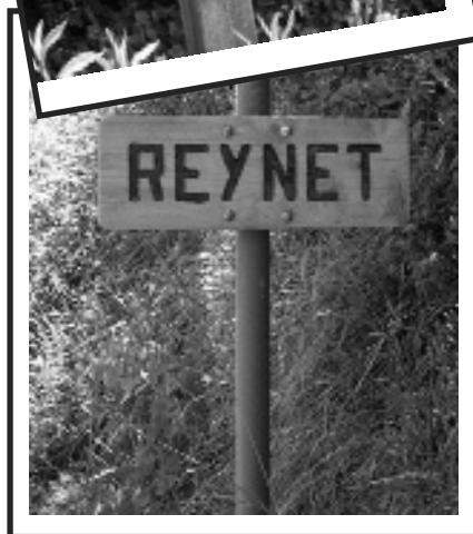
Les panneaux (volés ou endom- magés) indica- teurs de hameaux sont remplacés et des panneaux indica- teurs de direction sont apparus

Luc Quinton est venu présenter une expositions de ses "COLLAGES IMMÉDIATS POUR VENON" dans l'écurie de la ferme de Pressembois lors du dernier marché fermier.